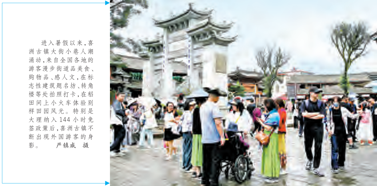
进入暑假以来,喜洲古镇大街小巷人潮涌动,来自全国各地的游客漫步街道品尝美食、购物品、感人文,在标志性建筑题名坊、转角楼等处拍照打卡,在稻田间上小火车体验田园风光。特别是大理纳入144小时免签政策后,喜洲古镇不断出现外国游客的身影。

8月21日,“风从东方来 彩云之南”沪滇文化交流座谈会在大理召开。 座谈会上,上海浦东新区一心公益理事长米晓军等一行与大理州市相关部门共聚一堂,就促进文化交流、推动沪滇合作进行深入交流探讨。米晓军一行表示,大理是历史文化名城,自然风光秀美、历史文化厚重、民族风情浓郁,是无数人的诗与远方。这次上海不仅带来朗诵、诗词方面的名家,还带来了优秀企业、公益基金等资源,希望以“风从东方来 彩云之南”沪滇文化交流活动暨“我在大理,为你读诗”主题朗诵活动为契机,不断加大大理的帮扶力度。同时希望沪滇两地能继续资源共享、优势互补,不断探索合作新模式,携手共同发展。 米晓军说:“我们2018年开始到大理做公益,6年时间里我们先后开展了‘爱阅读’‘书画梦想’‘音乐梦想’‘爱运动’等4个公益项目,覆盖了大理200多所乡村学校。随着教育公益的深入,我们希望能够把沪滇两地的文化交流上升一个台阶,想从教育的帮扶上升到文化协作。这次‘风从东方来 彩云之南’朗诵活动也是我们