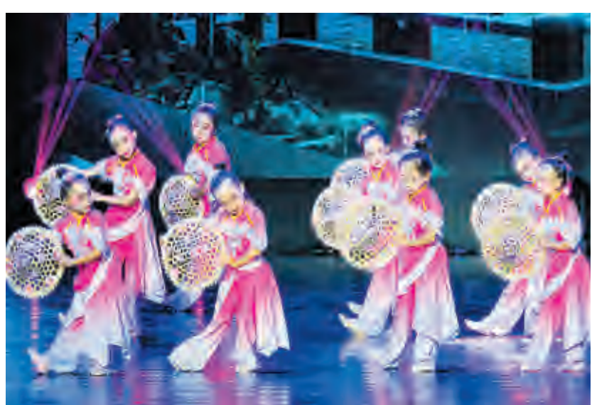
近日,由中国教育网络电视台青少年台主办的“舞蹈新生代2024年全国校园舞蹈电视展演”云南省区比赛近日在海东大剧院举行,金凤凰幼儿园受邀参加的2个节目分别斩获1个金奖、1个银奖。同时,幼儿园荣获“匠心艺术专研单位”称号。图为小朋友正在表演舞蹈《喜雨》。

6月28日19:05,1名20多岁的女孩到大理市政务服务中心,称6月29日要进行相关职业资格考证并出具准考证,但因身份证不慎遗失,急需办理临时身份证明,否则无法考试。此时,市政务服务中心所有窗口工作人员已下班,公安窗口工作人员王灿秀警官了解到这一情况后,急匆匆直奔市政务服务中心为女孩办理临时身份证明,解决了女孩的燃眉之急。