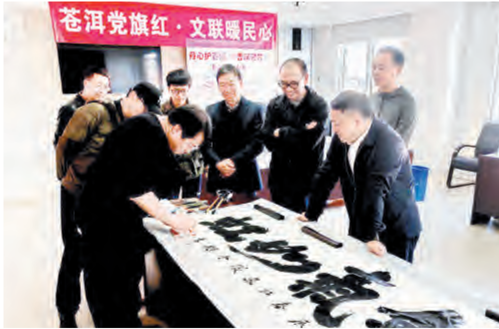
近日，市公安局凤仪派出所组织开展“丹心护苍洱、墨香润警营”主题党日活动，邀请辖区5位著名书法家现场挥毫泼墨，创作书法作品45幅，进一步夯实党员民警“对党忠诚、服务人民、执法公正、纪律严明”的思想和文化根基。参加活动党员民警表示，要以优秀传统文化涵养自己的思想和文化修养，积极为加快形成和提升新质公安战斗力贡献新力量、展现新作为。

全员出动“守安全”。全员出动，强化卡点值守，严格查堵火源，规范入山登记；加强林区、墓区巡查检查，严管违规祭祀、用火行为，全方位、立体式、不间断、无死角巡查管控，确保无盲区、无漏洞、无火灾隐患；严格落实每日16时清山清林工作，严防森林火灾发生。