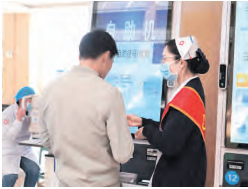
近日,大理市第一人民医院开展自助机使用推广志愿服务活动,让患者在高峰期能够快速、便捷就医。志愿服务主要内容是就医引导、指导自助挂号缴费等,实现挂号、缴费、打印清单一站式综合服务,为患者提供多种方式且更方便的服务。志愿服务活动的开展,避免患者各窗口来回跑、排错窗口等情况出现,缓解门诊大厅患者排队挂号缴费,节省患者就医时间。

中国宏观经济研究院经济研究所副所长郭丽岩说,激发大市场潜力,使生产、分配、流通、消费各环节更加畅通,才能提高市场运行效率,进一步巩固和扩展市场资源优势。