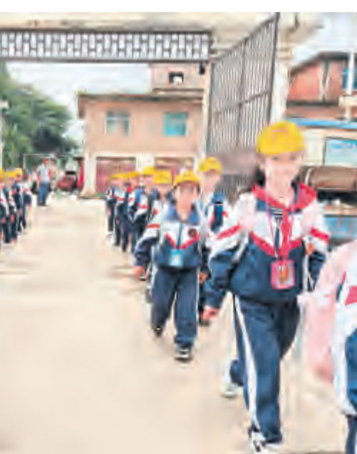
8月28日,我市义务教育阶段1至8年级如期开学。凤仪镇中心学校下属各中小学按照州市教体部门相关要求,提前谋划部署,切实做好各项准备工作,为秋季学期顺利开学提供有力保障。图为锦阜完小学生列队进入校园。

开展乡村建筑工匠培训是全面贯彻党的二十大精神,坚持以人民为中心的发展思想,提高工匠综合素质和技能水平,推动美丽乡村建设的重要举措。近期,我市分批组织开展2023年度乡村建筑工匠培训工作。 此次培训按照就近原则,在乡镇(街道)组班进行培训,每班次60人,培训时间为每期6天,全市13个乡镇(街道)的904名乡村建筑工匠参加培训。培训班充分整合农村劳动力转移培训政策,由专业培训机构采取理论授课和实操教学的方式进行,参训人员全程免费参加培训。理论授课主要内容为党的政策、法律法规及规章制度、农村建筑基础知识等,其中包括《云南省乡村宜居农房风貌引导图集(乡村振兴版)》《大理白族自治州农村建房通用图集》、大理市个人住房建设管理规定等具有地方特色的业务知识和规章制度。参训人员在培训结束后参加理论考试,考试合格者由市住建局发放《大理州乡村建筑工匠培训合格证书(初级)》。 通过持续开展乡村建筑工匠培训,进一步提升我市农村住房建设质量和水平,为打造有鲜明地方特色的生态宜居大理美丽乡村奠定良好基础。 杨智生