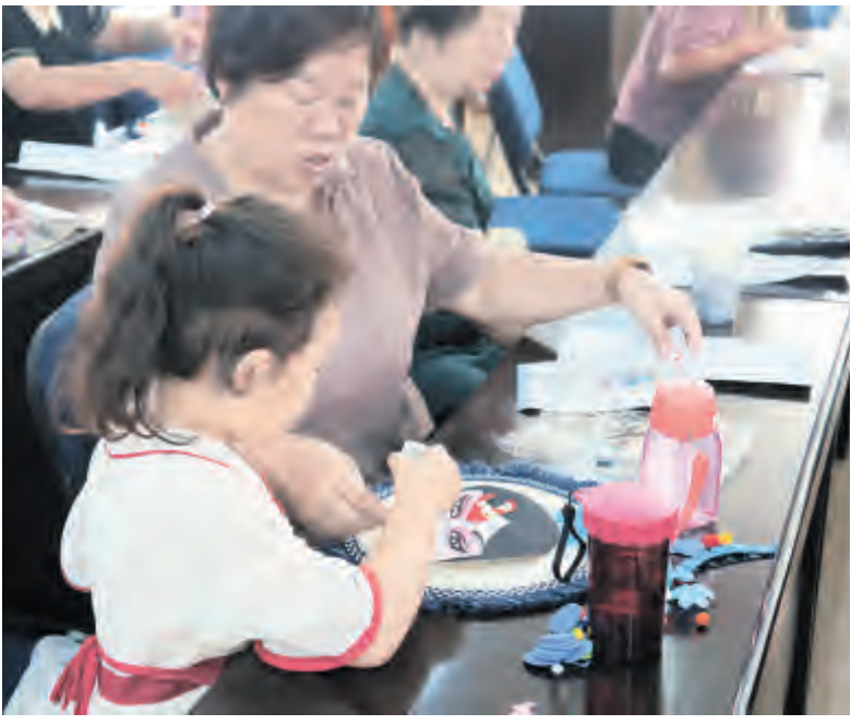
为传承弘扬中华优秀传统文化,让居民群众感受传统文化魅力,下关街道花园社区新时代文明实践站开展“我们的节日——七夕”手工制作活动。活动通过介绍七夕的由来、传统京剧脸谱相关文化知识和手工制作方法、制作京剧脸谱画,增进居民之间的相互交流,让中华优秀传统文化深入人心。

近年来,喜洲镇党委以党建引领,围绕“让数据多跑路,让群众少跑腿”目标,整合喜洲镇党群服务中心、游客服务中心、综治服务中心和旅游指挥调度中心,打造“大青树”便民服务中心,真正让便民、利民、惠民落到实处。 走进“大青树”便民服务中心大厅,“高效便捷办事、真诚优质服务”“最多跑一次”等标语格外醒目。为方便群众办事,中心入驻了民政、计生、社保、医保、劳保、退役军人事务服务、党团服务等11个群众高频服务事项。 喜洲镇党委副书记张庆文介绍,喜洲镇通过抓取大理白族村落“大青树”文化符号,取其为民服务、安心守护、生机勃勃之意,创建喜洲镇“大青树”党群服务中心,围绕服务便民、服务惠民、服务利民的宗旨,把服务距离再拉近,让服务环境再优化,使服务标准再提升,特色化打造行业领域党群服务工作品牌。