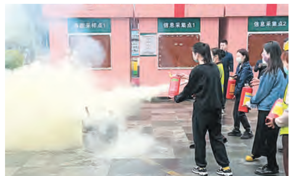
为切实做好消防安全工作，6月13日，下关街道花园社区联合辖区双林嘉悦物业开展消防安全演练活动，学习使用灭火器和如何扑救初期火灾等知识，并进行实战演练。下一步，社区将继续组织开展各类消防安全宣传活动，不断提升居民群众消防安全意识和防火自救能力。

近日，大理经开区组织开展2023年度入党积极分子和发展对象短期集中培训，通过个人自学、专题授课、观看红色影片、综合测试等方式，深入学习领会党章和党的基本理论、基本路线、基本方略等内容，切实把好党员队伍的“入口关”和“质量关”。 此次培训邀请州委党校5位教师进行授课，深入学习党的二十大精神，专题辅导《中国共产党章程》与党史学习教育，全面解读习近平新时代中国特色社会主义思想，并结合实际讲解新形势下党内政治生活准则和中国共产党纪律处分条例，阐述新时代对党员党性修养的新要求。参训学员共同观看了电影党课《1921》和警示教育片，深受启发和教育。 为检验培训成效，此次培训还组织学员进行理论测试，以考促学，切实增强党性意识、提高政治素质。全区80名入党积极分子和发展对象参加培训，区党工委向培训合格者颁发结业证书。 杨学泓