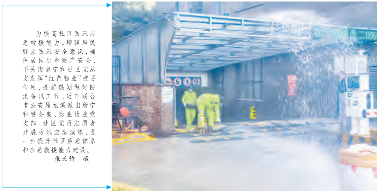
为提高社区防汛应急救援能力,增强居民群众防汛安全意识,确保居民生命财产安全,下关街道宁和社区党总支发挥“红色物业”重要作用,提前谋划做好防汛备汛工作,近日联合市公安局龙溪派出所和警务室、泰业物业党支部、社区党员志愿者开展防汛应急演练,进一步提升社区应急体系和应急救援能力建设。

在“五一”劳动节和三月街民族节之际,为营造欢乐祥和的节日氛围,我市对城区多个绿化景观节点的时令鲜花进行集中更换打造,焕然一新的各绿化景观节点花团锦簇、姹紫嫣红、生机盎然。