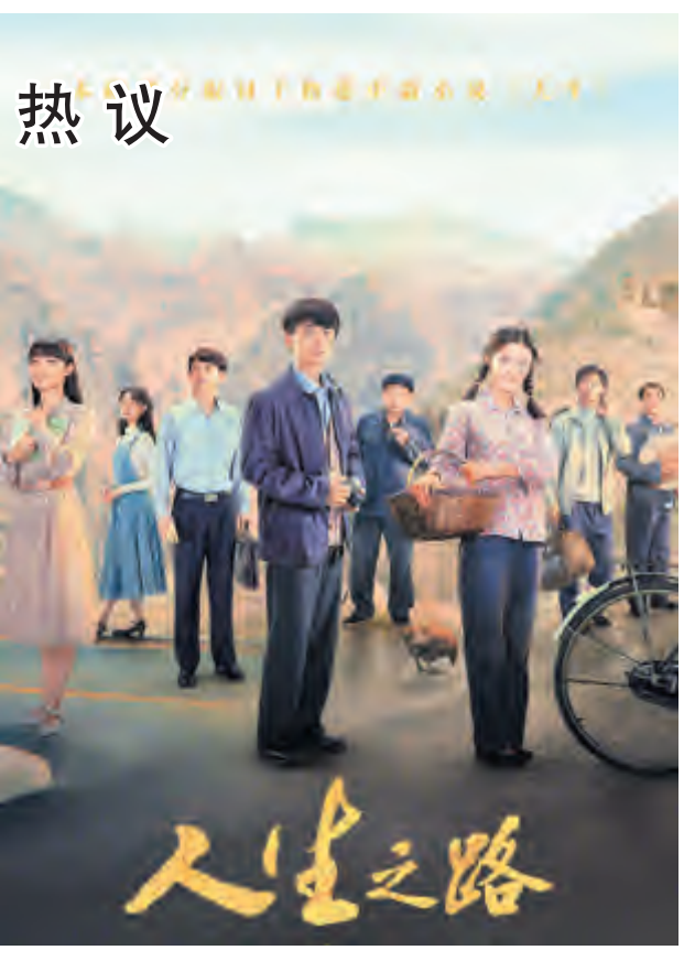
电视剧《人生之路》海报

多部文学改编作品待播 电视剧《人生之路》将观众的目光聚焦到文学作品改编影视剧领域。目前,多部文学改编作品待播,等待接受观众“检验”。