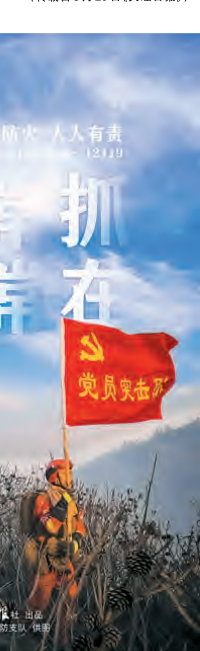
大理州森林消防支队训练场。

自普法强基补短板专项行动开展以来,市公安局喜洲派出所紧盯重点、增强自觉、全员参与,推行“123”工作法,全力推动普法强基补短板专项行动落地落实,为推动更高水平的平安大理、法治大理建