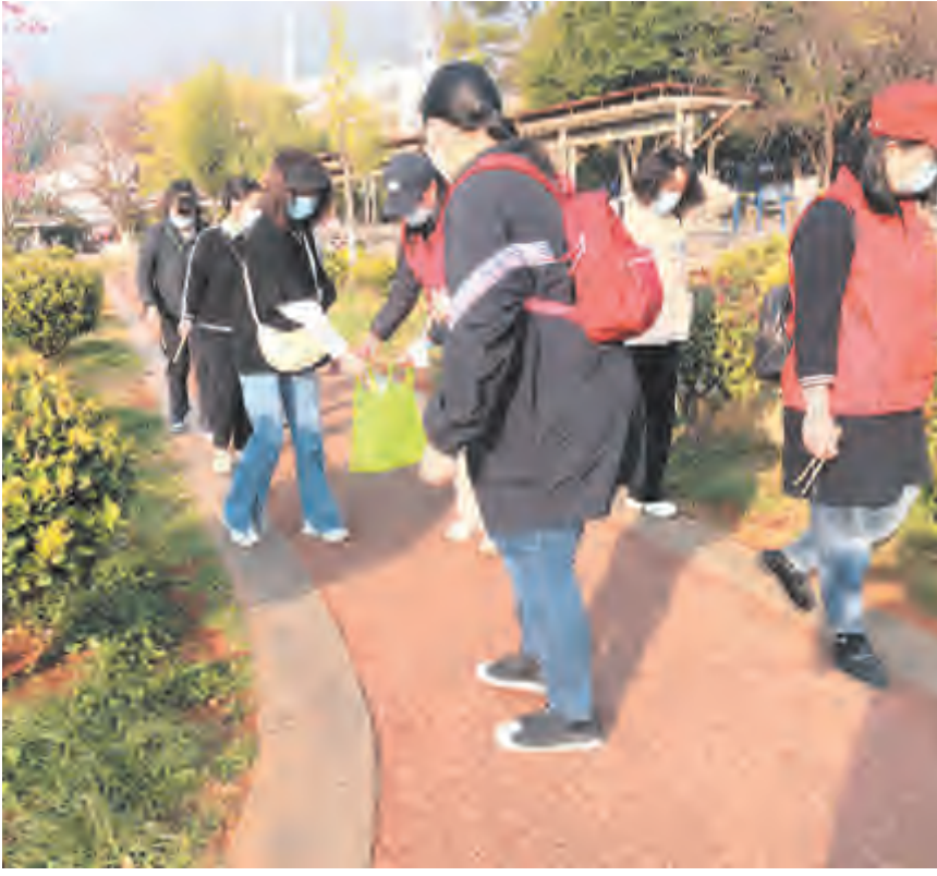
3月14日,太和街道关连社区组织党员志愿者开展“保护生态环境,共创文明城市”志愿服务活动。活动现场,志愿者们认真清理垃圾、烟头、纸屑,不遗漏任何的“蛛丝马迹”,社区环境面貌焕然一新。下一步工作中,关连社区将常态化开展志愿服务活动,引导广大居民群众爱护环境、绿色生活,树立健康、文明、积极向上的生活方式。