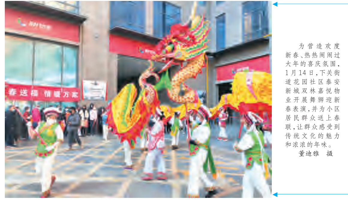
为营造欢度新春、热热闹闹过大年的喜庆氛围，1月14日，下关街道花园社区泰安新城双林嘉悦物业开展舞狮迎春表演，并为小区居民群众送上春联，让群众感受到传统文化的魅力和浓浓的年味。