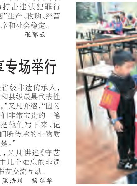
为减少和防止暑假安全事故发生,进一步增强辖区青少年学生假期安全防范意识,确保青少年过一个平安、快乐的假期,7月22日,下关街道守和社区开展以“快乐过暑假,安全不放假”为主题的暑假安全教育活动,邀请市红十字会老师为孩子们上了一堂集防溺水、应急演练、交通安全等为主要内容的安全知识讲座。