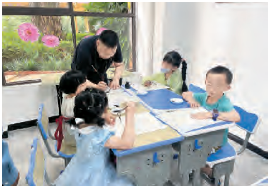
▲为了给辖区青少年儿童营造良好的学习氛围,下关街道和社区党总支联合泰业物业党支部开办暑期课外作业辅导、书法、绘画、剪纸等为期一个月的培训班。7月18日开班仪式上,活动邀请大理市知名书画家、中国剪纸艺术非遗文化传承人等专家老师为兴趣班小朋友作指导。

率不高,我们就组织了一次义务植树活动。一些企业给我们捐赠了苗木,我们组织镇村组党员干部进行植树。生态文明已成为党员干部的共识,大家积极投身义务植树活动。”