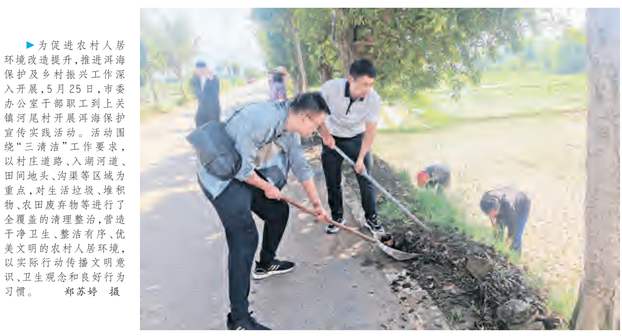
▶为促进农村人居环境改造提升,推进洱海保护及乡村振兴工作深入开展,5月25日,市委办公室干部职工到上关镇河尾村开展洱海保护宣传实践活动。活动围绕“三清洁”工作要求,以村庄道路、入湖河道、田间地头、沟渠等区域为重点,对生活垃圾、堆积物、农田废弃物等进行了全覆盖的清理整治,营造干净卫生、整洁有序、优美文明的农村人居环境,以实际行动传播文明意识、卫生观念和良好行为习惯。