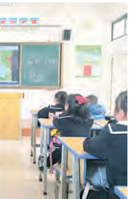
为切实做好春季防火安全工作,提高全校师生的森林防火意识,近日,下关街道福星完小开展森林防火“五个一”宣传活动,以“小手拉大手”的形式增强师生和家长的防火意识,杜绝火灾事故发生。

员、基层医务工作者、民警、志愿者共同抓好疫情防控工作,筑牢联防联控、群防群控的坚固防线。 突出示范带动,彰显党员先锋本色。全镇党员干部闻令而动,带头遵守疫情防控各项规定,做到无差错、无遗漏;带头做好个人防护,勤洗手、戴口罩、不扎堆、不聚集;带头减少不必要的串门走访、聚会聚餐。同时,积极配合医疗卫生机构人员排查、采样检测等防控管理措施,如实提供有关信息,坚决落实相关管理规定,以身作则、争当表率,充分发挥先锋模范作,在“我是党员我先上,疫情不退我不退”的实践中构筑起疫情防控的坚强战斗堡垒。