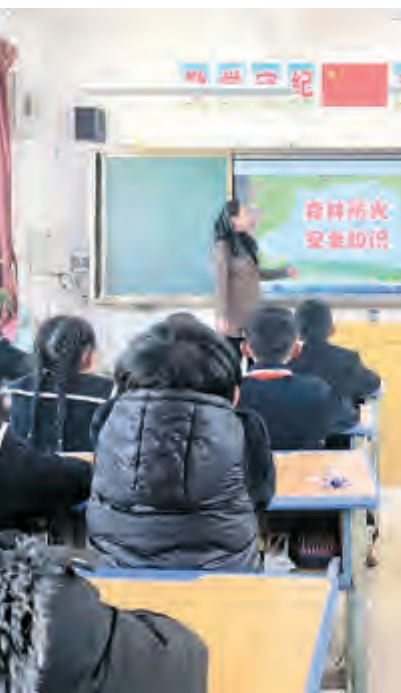
为切实做好春季防火安全工作,提高全校师生的森林防火意识,近日,下关街道福星完小开展森林防火“五个一”宣传活动,以“小手拉大手”的形式增强师生和家长的防火意识,杜绝火灾事故发生。

发挥组织优势,严格管控筑牢防线。全镇各村党组织和医疗卫生、教育等党组织充分发挥政治优势、组织优势和密切联系群众的优势,积极落实防控措施,组建党员先锋队、志愿者开展疫苗接种和防疫宣传,在疫苗接种点设置党员先锋岗,开展“暖心行动”,针对“一老一小”、残疾人等群体接种疫苗开设绿色通道,提供免费上门接送服务。同时,发布《湾桥镇关于取消2022年“接金姑”“三月三”朝山会民俗活动的通告》,严控庙会、大型文艺演出、展销促销等活动,并对全镇麻将馆(棋牌室)、超市、农贸市场、学校、村委会、村活动室等重点场所进行督促检查;实行“五包一”,由乡镇党员干部、村级网格员、