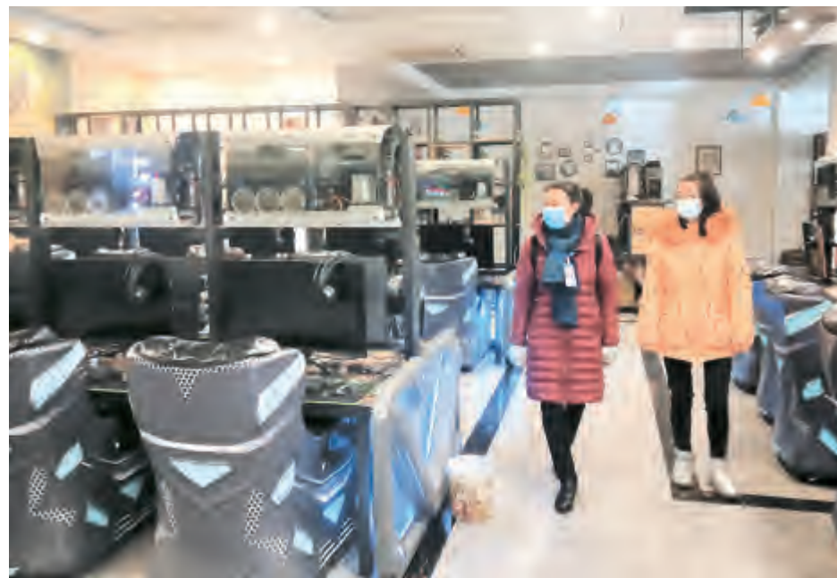
为积极发挥“五老”监督员优势,营造健康文明的网络环境,1月28日,凤仪镇关工委组织“五老”网吧监督员深入城区各网吧开展巡查活动。巡查过程中,监督员认真检查网吧上网人员是否按防疫规定佩戴口罩,有无未成年人上网,认真核查网吧登记簿,核实上网人员年龄、身份证等信息,并对网吧制度是否上墙、安全疏散通道是否畅通、环境卫生是否清洁等情况进行详细查看,指出问题和不足,并提出整改措施。