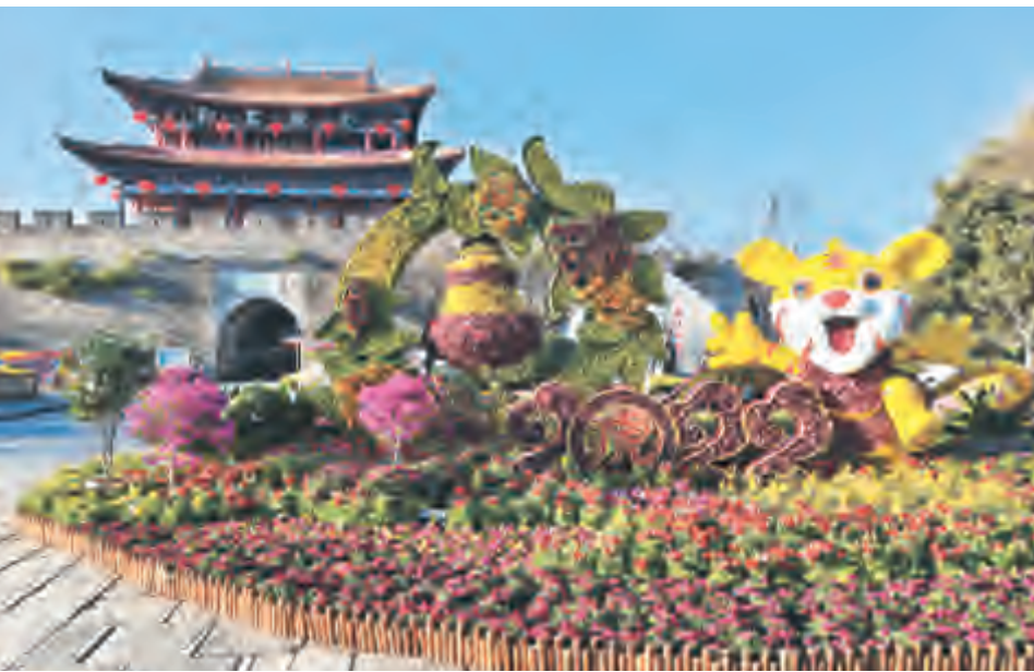
►新春佳节之际,大理古城增添了新的绿化景观,营造了浓厚的节日气氛。在南门广场和街道上,一个个由各色花卉、多肉植物和卡通虎雕组成的绿化景观,一道道由本土花卉组合成的靓丽风景,为大理居民和过往游客带来节日的祝福和新春的气息。

去年以来,我市深入推进洱海流域综合联动强力执法,有效扼制洱海周边的违法违规行,切实巩固洱海保护治理“八大攻坚战”作战成果。为达到运转高效、灵活机动的