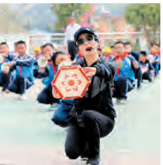
自“双减”政策实施以来,凤仪镇各中小学校积极开展劳动教育与实践、艺术类、体育类、益智类等种类多样的课后服务活动。图为东山完小聘请的校外辅导员在指导学生跳白族八角鼓舞。

服务队,设226名网格员,联合辖区8个行政村的村组干部,广泛开展“庭院会”及“敲门入户”行动16972人次、召开小区户长会500余场次;与农村党员签订文明承诺书1417份,与农户签订“门前四包”责任书7900余份;组织开展志愿服务20000余人,清除卫生死角300余处,清运垃圾、杂草1500多吨;发放树文明新风宣传资料2万余份、人居环境整治宣传手册、文明创建倡议书等16600余份;开展志愿服务活动1600余场次。而“红马褂”忙碌身影,也点亮了乡村文明的“风景线”。 赵志斌