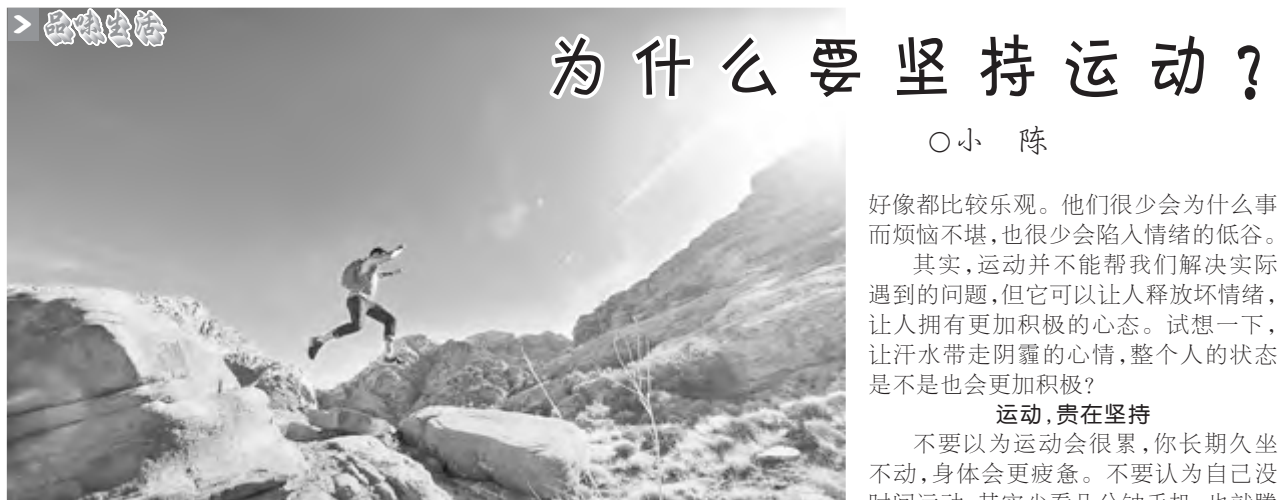
为什么要坚持运动？

北方有“大雪小雪，煮饭不息”的谚语，说的是大雪时节天寒地坼、昼短夜长，百姓家一日赶着做三餐饭，几乎没有歇息。大雪之后便进入仲冬，万物闭藏，古人以仲冬之月为“畅月”，“畅”是充盈的意思，此时万物当充实于内而不发动于外。《礼记·月令》记载周天子命有司云：“土事毋作，慎毋发盖，毋发室屋及起大土，以固而闭。”凡是有关土地之事，不得兴作；凡有盖罩覆之所及房屋室室皆不得掀开顶盖，也不可兴师动众，以此来稳固阳气。古人的“闭藏”观