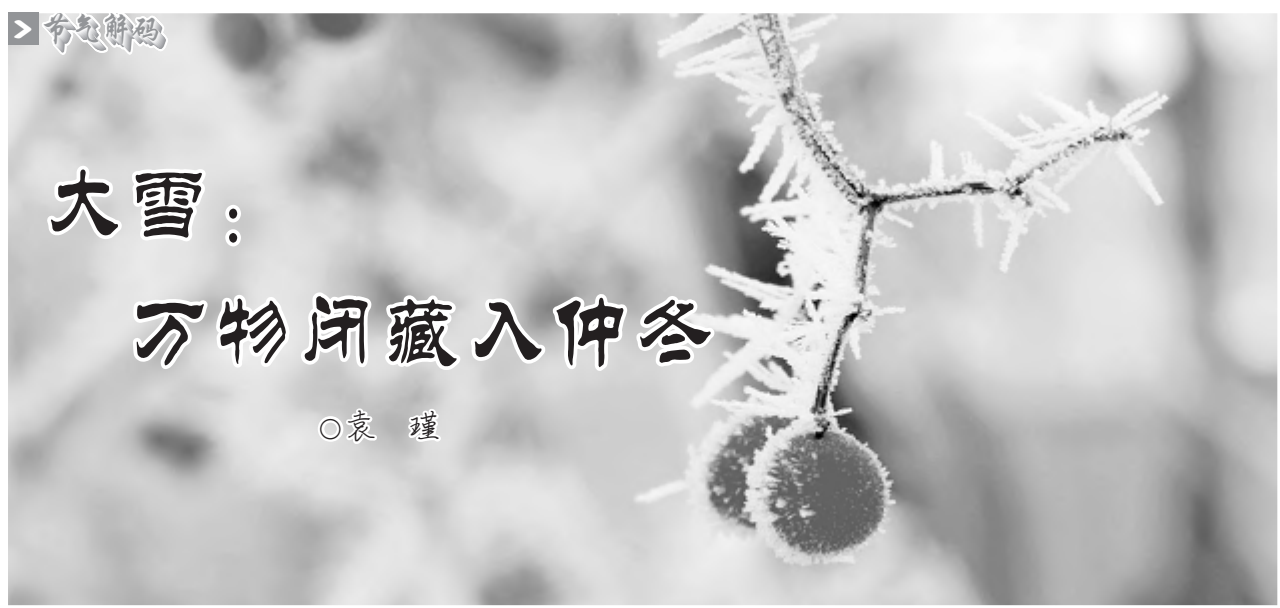
大雪：万物闭藏入仲冬

岁月无声，节气轮转。小雪过后15日即迎来大雪。节气之名，直言气候变化，《月令七十二候集解》云：“大雪，十一月节。大者盛也，至此而雪盛矣。”雪重压枝、道路积雪的情况时有发生，正如白居易《夜雪》中所写：“已讶衾枕冷，复见窗户明。夜深知雪重，时间折竹声。”南宋周密在《武林旧事》中描绘了临安（今浙江杭州）城内王公贵戚雪后玩乐的情景，“后苑进大小雪狮儿，并以金铃彩缕为饰，且作雪花、雪灯、雪山之类。”又用金盆盛着雪雕的诸般玩意儿拿到室内赏玩，别有一番趣味。