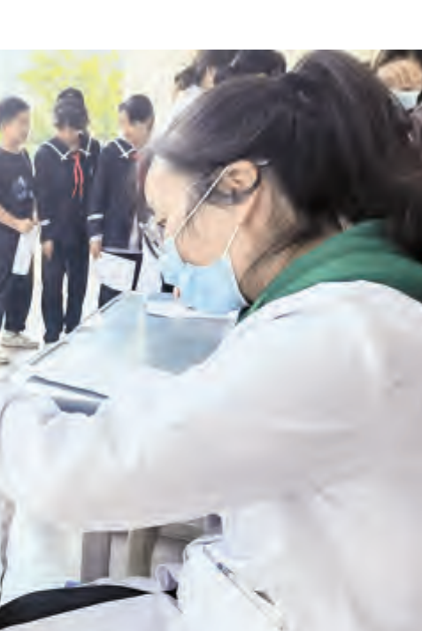
凤仪镇切实加强青少年健康教育工作,每年定期开展在校学生体检工作,建立健全学生健康档案,为学生健康成长保驾护航,保证孩子们健康快乐成长。图为凤仪卫生院医务人员深入白塔小学为在校学生进行2022年度健康检查。