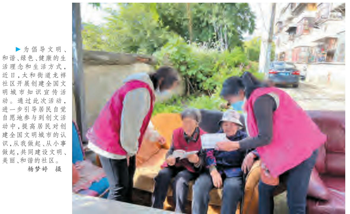
为倡导文明、和谐、绿色、健康的生活理念和生活方式,近日,大和街道龙祥社区开展创建全国文明城市城市知识宣传活动。

好安全生产工作;要坚持目标导向,强化施工力量,科学合理安排施工时间节点,倒排工期,抢抓施工有利时机,提高施工效率,在保证工程建设质量和施工安全的前提下,如期完成目标任务,让民生工程早日惠及广大市民群众。 市委常委、市委办主任张宇,副市长汤中国,市住建局、施工单位、项目管理单位相关负责人参加调研。 记者 唐攀伟 吴志