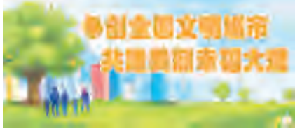
争创全国文明城市 共建美好和谐大理

和街道挂钩党员干部主动下沉一线、干在一线，统筹人力、物力，深入关迤社区各居民小区、背街小巷开展人居环境“地毯式”清理，全面提升巩固人居环境整治成果。 当好“创文劝导员”。为进一步推进关迤社区创文工作常态化开展，营造安全文明的社区环境，社区网格员成立劝导队，对居民小区占道停升居民群众的满意度和幸福指数，助力全国文明城市创建。 下一步工作中，关迤社区党总支将继续发挥基层党组织战斗堡垒作用，切实强化责任意识、担当意识，将居民群众的“幸福清单”转化为全国文明城市创建的“责任清单”，为全国文明城市创建助力添彩。 李虹霞