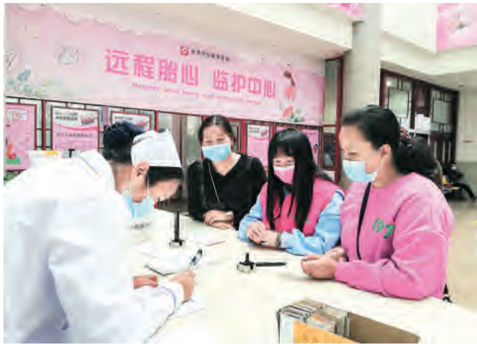
近日，下关街道启动农村妇女“两癌”免费筛查项目，向符合条件的人员开展“两癌”筛查宣传，真正让广大农村妇女尽享美好生活。筛查过程中，市妇幼保健院医务人员悉心为前来检查的妇女做好体检登记、健康咨询以及项目检查引导等服务，耐心解答各种疑问，向妇女群众宣传健康养生、妇科疾病防治等知识。