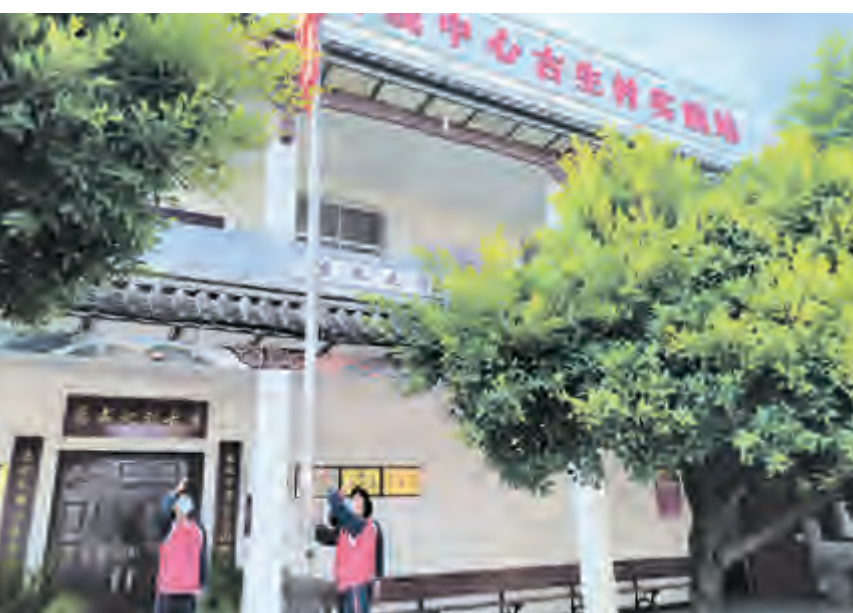
实际行动，以实实在在的成效报效祖国、报答人民，与国家共命运、与时代同发展、与人民齐奋进，同时为喜迎党的二十大胜利召

会议指出，当前，大理市正处于洱海保护、流域转型的关键期，处于爬坡过坎、滚石上山的艰难期，处于改革创新、破解难题的攻坚期，老干部们党性强、阅历广、威望高，有着丰富的革命和建设经验，是大理市发展建设非常重要的智力宝库。希望