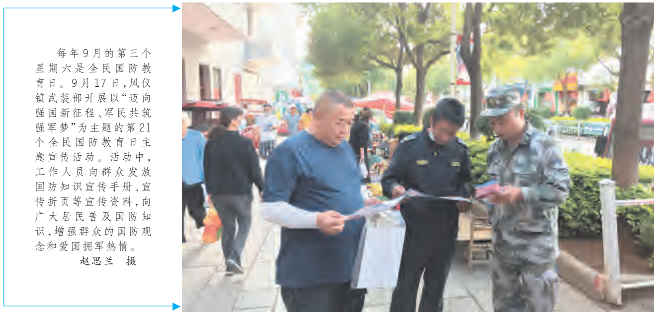
每年9月的第三个星期六是全国国防教育日。9月17日,凤仪镇武装部开展以“迈向强国新征程、军民共筑强军梦”为主题的第21个全民国防教育日主题活动。活动中,工作人员向群众发放国防知识宣传手册、宣传折页等宣传资料,向广大居民普及国防知识,增强群众的国防观念和爱国拥军热情。