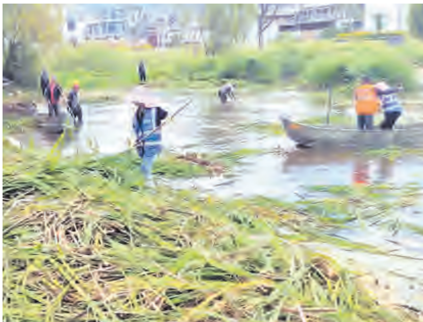
记者 朱滢 吴志

我市通过采取试点先行，示范安装四分分类垃圾收集设施，全面取缔主次干道公共垃圾收集点，加强垃圾密闭储存与运输管理，通过合理配比机械化清扫及人工保洁方式等一系列举措，扎实推进爱国卫生“清垃圾”专项行动。