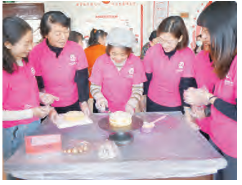
3月8日,下关街道西大街社区组织全体女职工、辖区妇女欢聚一堂,举办“巧手做蛋糕,甜蜜妇女节”趣味活动。活动现场欢声笑语、温馨热闹,大家品尝着自己动手制作的蛋糕,甜蜜的滋味在舌尖蔓延,幸福的笑容在嘴角绽放,感受到自己动手制作美食的快乐,度过了一个难忘的“三八”妇女节。

满江街道 为庆祝“三八”国际劳动妇女节,进一步调动辖区广大妇女群众的积极性和创造性,弘扬家庭美德、社会公德、职业道德,满江街道妇联结合实际,开展形式多样、丰富多彩的活动,让妇女同胞度过一个快乐、祥和而又难忘的节日。 巾帼志愿者们走上街头。街道妇联联合工会、共青团开展纪念“三八”国际劳动妇女节111周年暨“洱海保护日”主题宣传活动,累计发放反对家庭暴力、青春期健康知识、无烟生活、爱国卫生“7个专项行动”、禁毒、妇女维权、洱海保护倡议书等宣传资料3000余份,安全套2000只,宣传用品150提,宣传布袋500多个。同时,现场免费为群众测量血压220人,接受各类咨询57起。