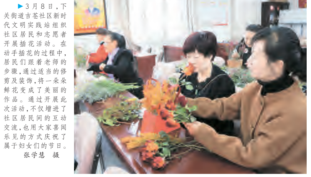
3月8日,下关街道吉巷社区新时代文明实践站组织社区居民和志愿者开展插花活动。在动手插花的过程中,居民们跟着老师的步骤,通过适当的修剪及装饰,将一朵朵鲜花变成了美丽的作品。通过开展此次活动,不仅增进了社区居民间的互动交流,也用大家喜闻乐见的方式庆祝了属于妇女们的节日。

情系困难妇女,慰问暖人心。在充分掌握辖区困难妇女生活保障情况的基础上,街道妇联分头前往辖区10位困难妇女家中进行走访慰问,为她们送去“娘家人”的温暖,用实际行动诠释组织关怀。每到一处,慰问组都详细了解困难妇女近期生活、身体状况,鼓励她们要乐观面对生活中的困难,努力靠自己勤劳的双手,创造美好生活。 弘扬雷锋精神,传承榜样力量。3月5日是学雷锋纪念日,街道各村(社区)妇联组织广大妇女、党员干部及志愿者先锋队开展辖区卫生清洁活动,对道路绿化带垃圾杂物、树坑内烟头、小广告进行清理,彻底清除卫生死角,努力提高群众环保意识,增强改善人居环境的积极主动性,充分发挥半边天作用,营造干净整洁的人居环境。 杨传秋