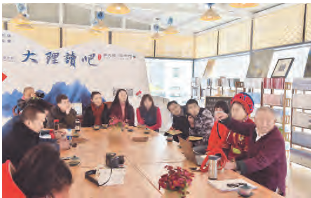
2月14日至17日,由州图书馆举办的大理读吧第58期——张锡禄教授茶马古道春节系列讲座举行。讲座期间,张锡禄教授讲述了自己50余年对茶马古道的研究成果,并与书友现场互动交流,为大理春节文化活动奉献了一道别具一格的文化大餐。