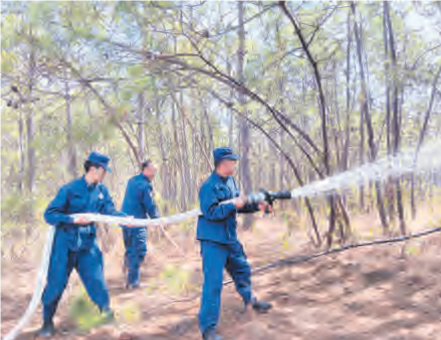
1月26日,双廊镇组织200余人参加森林防火应急演练。此次演练有效提高了森林防灭火的应急处置能力、安全意识和操作技能,确保在可能发生森林火灾时扑救人员能迅速响应、有序推进、控制火情,为保障人民群众生命财产安全打下了坚实基础。