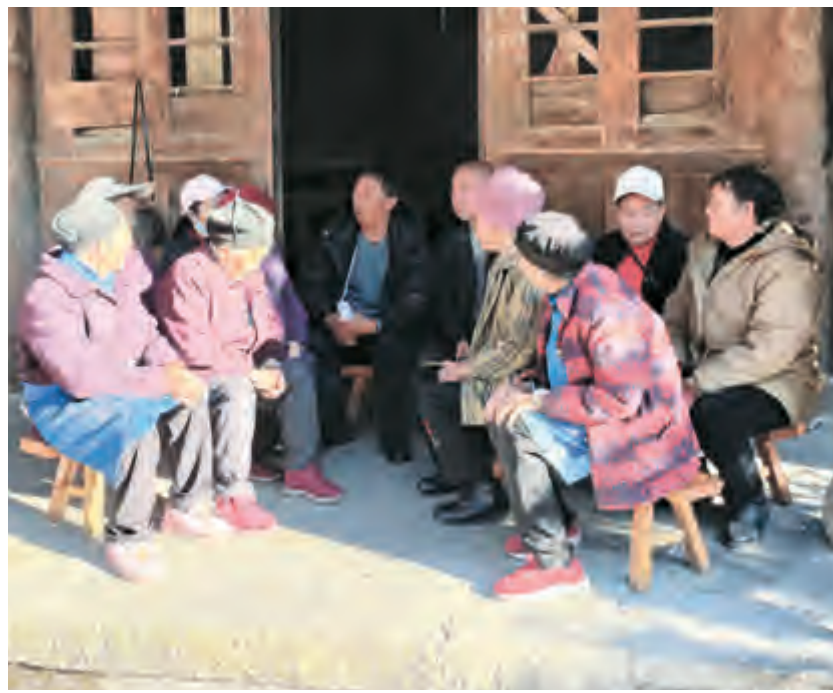
为进一步推动60岁以上人群新冠疫苗接种工作,近日,太和街道温泉村党总支组织开展陪同老年人疫苗接种志愿者服务活动,全力配合做好宣传发动、现场登记、引导接种等工作。对于行动不便的老年人,志愿者全程跟踪服务,确保接种工作顺利开展。