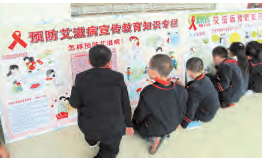
12月1日是第34个“世界艾滋病日”。当天,凤仪镇中小学纷纷开展形式多样的宣传教育活动,提高青少年学生对毒品和防治艾滋病的知晓率和参与率。图为华管完小学生观看艾滋病防治宣传展板。