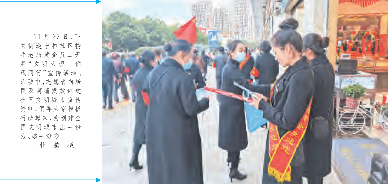
11月27日,下关街遵守和社区携手老庙黄金员工开展“文明大理 你我同行”宣传活动。活动中,志愿者向居民及商铺发放创建全国文明城市宣传资料,倡导大家积极行动起来,为创建全国文明城市市出一份力、添一份彩。