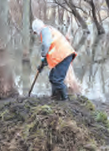
为确保持续改善提升，连日来，我市“洱海卫士”不畏寒冷、不惧辛劳，坚持奋战在洱海保护一线。