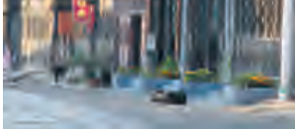
心随景动，景生永州。

在一处偏僻的山壁旁，一块破旧的门楣上写着“九嶷山学院”五个大字。走进去，里面已十分荒芜，野草杂乱地在抗洼的地面上滋生。教学楼则被改成了一所幼儿园，一群小朋友在里面欢快地嬉戏。透着布满灰尘的窗户，仍可见教室里曾经的座椅，只不过人已散尽，兴许是早已荒废了。