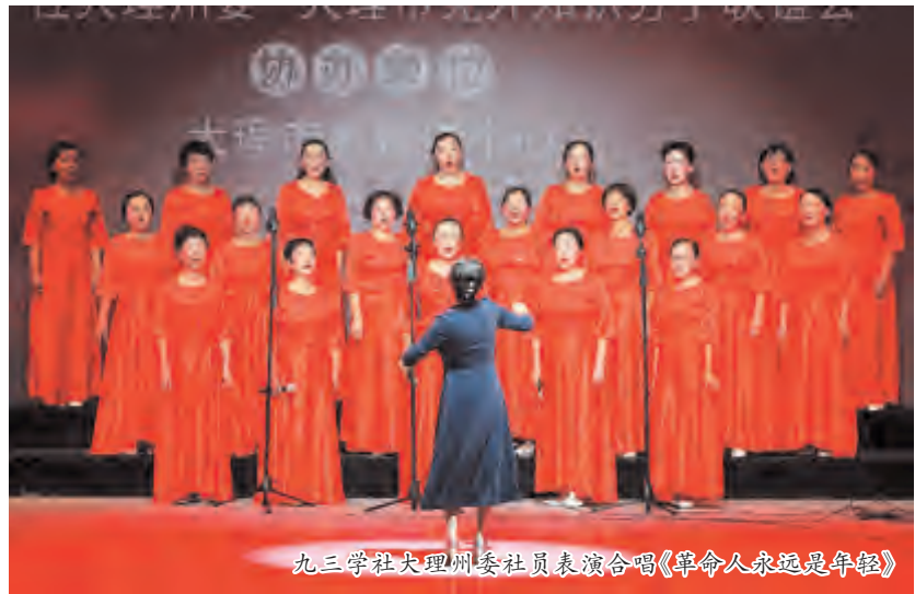
九三学社大理州委社员表演合唱《革命人永远是年轻》

精彩的舞蹈。通过联谊活动,进一步凝聚全体民主党派人士和党外知识分子的向心力,激励大家志存高远、敢为人先,立鸿鹄志、做中华梦,展大鹏翅、圆中华梦。