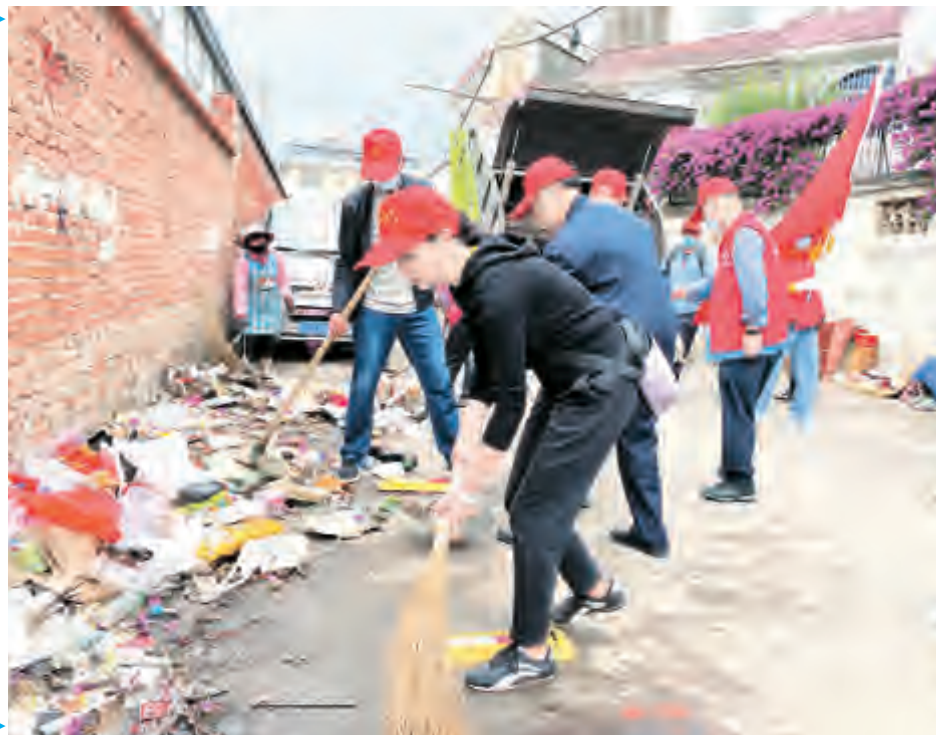
近年来,“社区吹哨、党员报到”机制使全市社区党组织建设更加牢固、城市治理水平有力提升、市民幸福感不断增强,社区党建和城市治理实现互融、互促、共进的良好局面。图为7月10日,太和街道万花社区党总支开展“火红七月·党旗飘扬”环境卫生大整治活动。

抓好日常。街道成立后,秉承“生态环境重在日常”,充分调动库塘、滩地和河道管理员的工作积极性,有效提升蓝藻打捞专业队伍日常效率,增强生态环境巡查分队发现问题能力,明确5支队伍的“时间表、路线图、责任人”,抓好日常清理、打捞、巡查、监控等工作。同时,全面谋划库塘、滩地、河道、沟渠、管网管理改造工作,建立生态环境长效机制,努力实现生态环境持续改善,确保完成辖区“清水入湖”目标。 左兴亮