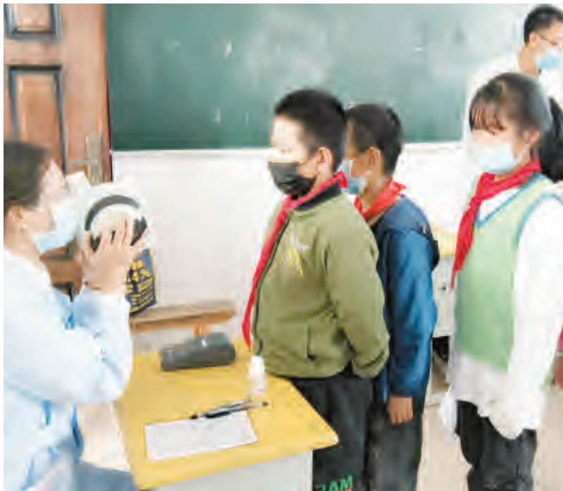
图为市妇幼保健院医护人员为凤仪镇三哨完小学生进行健康体检。

当天,市妇联干部职工还来到市儿童福利院给孩子们送上生活用品,祝福孩子们开心快乐、健康成长。 记者 朱滢 杨振飞