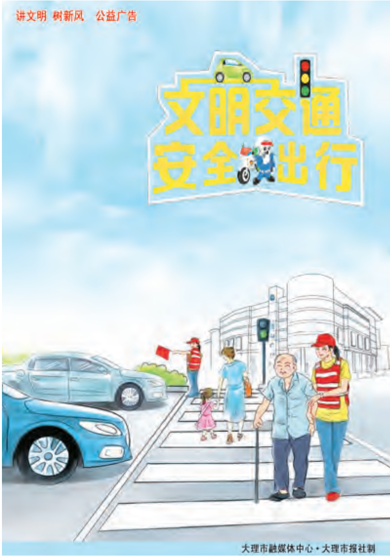
大理市融媒体中心·大理市报社制