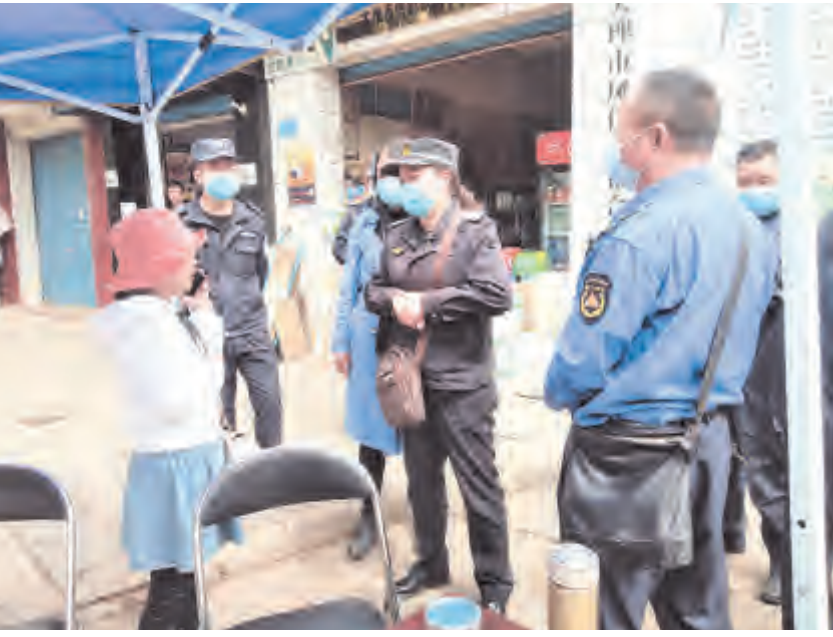
记者 鲍亚颖 杨尔华