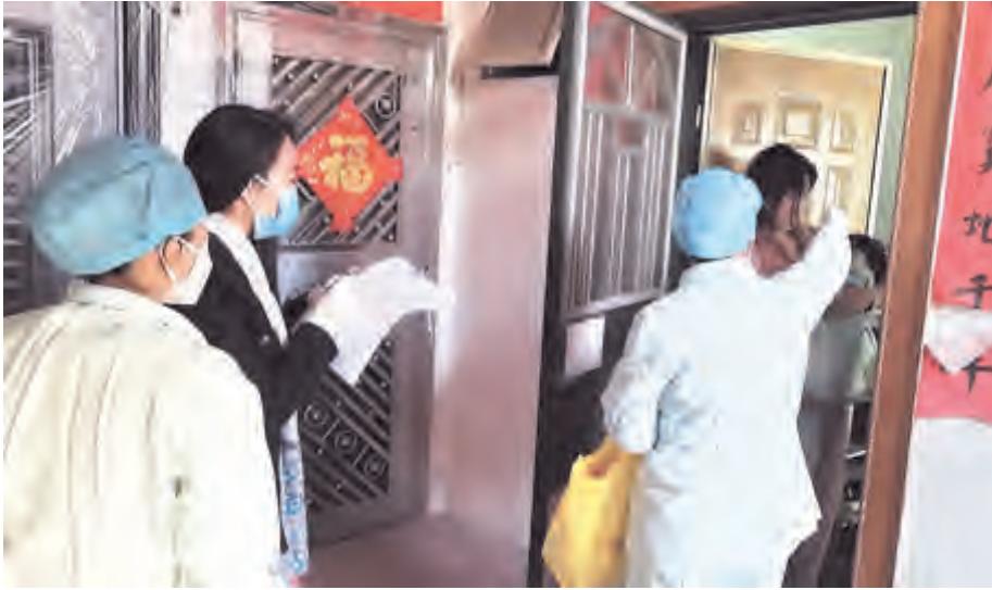
新冠肺炎疫情发生以来,大理经开区云岭社区安排社区卫生服务中心2名党员医务人员定期对辖区居家自我隔离留观187名人员、定点酒店集中隔离留观17名人员开展健康教育及心理疏导,广泛普及科学防护知识,积极做好关心关爱,帮助留观人员树立积极乐观的情绪、健康向上的心态,增强心理免疫力,纾解焦虑和恐慌心理。

织牢“房东责任制”,固守防控“安全关”。成立以党委委员任组长,镇机关部门负责人、各村党总支书记为成员的房东疫情防控工作领导小组,对辖区126家客栈(合法)、229家(个人私营)出租户,编织镇村组“房东责任制”,实行“房东”负责制,做好《房东责任书》的签责,“客栈或出租屋信息”的关停挂牌及全覆盖工作,落细落小落实责任人,确保对外来人员的防控“不打滑”、责任“不空转”。在此基础上,将疫情防控指引、市镇《致全体公民一封信》和1500份宣传海报广泛刊播在电子屏、张贴在路边公告栏和出租房、客栈人(门)口处,广泛凝聚党员和群众工作合力,引导屋主、商业个体和租户参与联防联控。从1月21日开始,组织安排28组专业人员每天对村内外菜市场消杀2次,对公共场所、出租房、垃圾桶、卫生死角及时清洁、杀毒,严防病菌藏纳;要求房东必须动态掌握和报告租户是否为重点控制区籍或从重点控制区籍到村情况,提醒租户积极做好防控工作;要求房东认真对人住人员做好来源地登记工作,切实把好固守防控的“安全关”。