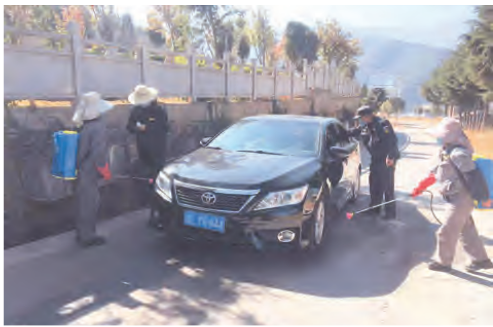
新冠肺炎疫情发生以来,青光山公墓管理所党支部8名党员全部到岗,对进入墓区的车辆进行全面消毒,对进入墓区的人员进行体温监测,切实将上级民政部门“外防输入、内防输出”的要求落实到位。