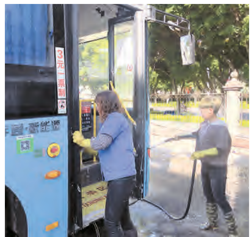
市公共汽车公司密切关注一线岗位人员身体状况,并要求驾驶员营运中佩戴口罩,车辆到达终点进站后,及时对车辆进行清洁消毒,并做好车内的通风透气。图为工作人员将稀释后的消毒水对手扶、座椅、地面、垃圾桶反复喷洒,并进行认真擦拭,让市民放心乘车。

11月24日,满江街道举行满江、珠海社区集中授牌授印仪式。 “村改居”工作是城市化建设的必然要求,是推进城市化进程中具有里程碑意义的一步。随着大理经济的快速发展,满江街道办事处满江、天井2个村委会满足了“村改居”条件,撤村设居是广大村民的共同心愿和选择,也是市委、满江街道党工委审时度势、顺应民心做出的重大决策。“村改居”后,村民转变成居民,社区步入了新的发展阶段。 授牌授印仪式上宣读了《大理市人民政府关于同意将满江、天井两个村委会改为社区居委会的批复》,同意撤销满江村民委员会设立满江社区居民委员会,撤销天井村民委员会设立珠海社区居民委员会,并为满江、珠海2个社区授牌授印。 下一步,满江街道将进一步推进城乡一体化建设进程,深化统筹城乡综合改革,不断加强社区的党组织建设,强化社区功能,发展社区服务,提高居民生活质量和文明程度,成为管理有序、服务完善、环境优美、治安良好、生活便利、人际和谐的城市社区。 黑浩川 李梅