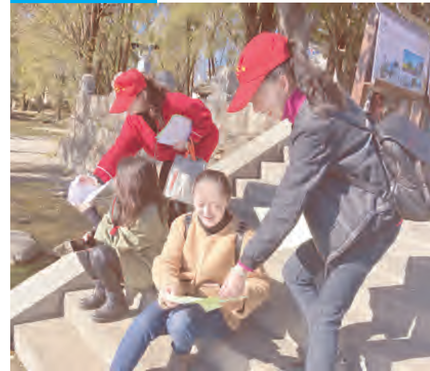
近日,下关镇吉苍社区组织志愿者在洱海边开展洱海保护志愿服务活动。志愿者们对沿线垃圾进行清理,向行人发放《洱海保护倡议书》《文明观鸡倡议书》等宣传资料。通过开展宣传,倡导广大市民用实际行动保护洱海、保护环境,增强环保意识,做洱海保护的参与者和同行者。