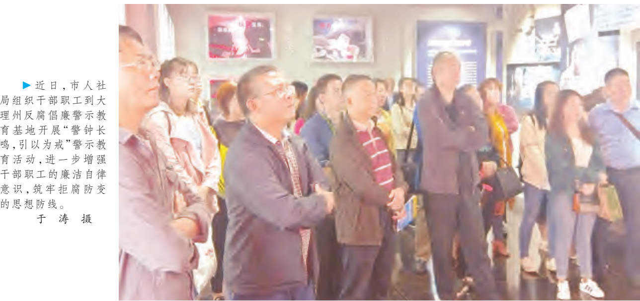
近日,市人社局组织干部职工到大理州反腐倡廉警示教育基地开展“警钟长鸣,引以为戒”警示教育活动,进一步增强干部职工的廉洁自律意识,筑牢拒腐防变的思想防线。