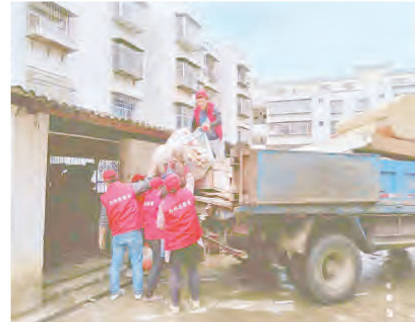
近日，下关镇榆华社区在辖区范围内开展环境卫生大整治活动，同时结合“三清洁”和创建国家卫生城市的相关活动进行开展。通过此次环境卫生集中整治活动，不但改善了辖区环境卫生状况，还带动辖区居民群众增强环境保护意识、卫生意识、家园意识，切实做到了家喻户晓，真正做到了整治一处、清洁一处、靓丽一处。

9月18日，市公安局、市洱管局、市市场监管局等部门组成综合执法组开展专项整治行动，对洱海流域非法制造销售禁用网具、非法加工鱼产品等违法行为实行“零容忍”，建立健全动态巡查制度，将发现的违法行为处置在萌芽状态，巩固洱海保护成果。 此次专项整治行动以全市网具制造销售商户、银鱼加工厂等为重点，严厉打击非法制造、非法销售、非法生产等违法行为，做到调查在先、发现及时、制止有效、查处到位，使各类洱海保护治理工作中潜在的问题得以解决。从源头抓起，杜绝违禁网具买卖，对非法加工银鱼等产品的工厂、企业坚决予以取缔、查封，构建洱海渔业良好秩序。 当天，综合执法组首先深入下关苍保巷、集市巷，对正在营业的渔具店进行随机抽查。工作人员认真排查，耐心宣传，发现违禁网具的，立即予以没收，并对商家进行宣传教育。随后，综合执法组深入大理、银桥、湾桥等沿湖乡镇，对网具制造销售户、鱼产品加工厂等进行检查，进一步宣传洱海保护的相关法律法规，对多次宣传教育未整改的商户、企业，进行依法取缔和查封。 下一步，我市将进一步加大宣传教育力度，实行典型案例公开曝光，做到查处一起、警示一方，处理一人、教育一片，积极营造良好执法氛围，对每一宗案件确保做到事实清楚、证据确凿、处理恰当。为提高执法效能，工作组办公室还将邀请纪检监察、督查室等部门对洱海联动执法案件进行跟踪问效。 记者 彭黎明