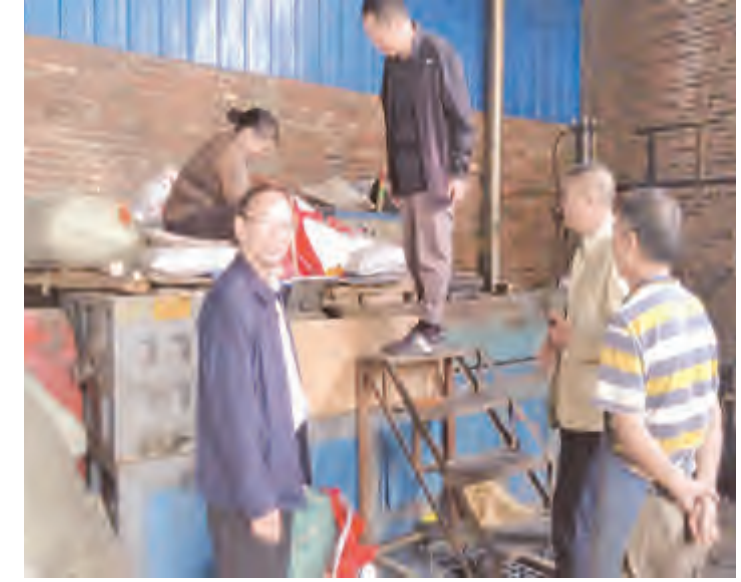
近日,城管局举行“禁白”工作第八次塑料制品公开销毁活动,此次共销毁收缴的塑料制品37.8吨。通过此次销毁塑料制品活动,让广大市民充分认识到开展“禁白”工作的重要性、必要性和紧迫性,使“禁白”工作深入人心、家喻户晓、人人皆知,形成良好的“禁白”舆论氛围。

征文作者文责自负。来稿请注明“守望洱海·逐梦乡愁”有奖征文”字样,文末附作者姓名、工作单位、通讯地址及联系电话。 三、征文投稿方式: 电子稿件请发送至邮箱:dlsxtg@163.com;信件请投寄至:大理市下关苍山路23号大理日报社,邮编:671000。 四、征稿时间: 即日起至2019年11月30日。 五、有关事项: 1. 奖项设置 一等奖2名,每名奖金2000元; 二等奖6名,每名奖金1000元; 三等奖10名,每名奖金500元; 优秀奖若干,每名奖金200元。 2. 来稿将择优刊登,优稿优酬,并向获奖者颁发荣誉证书和奖金。 中共大理市委宣传 大理日报社 2019年1月9日