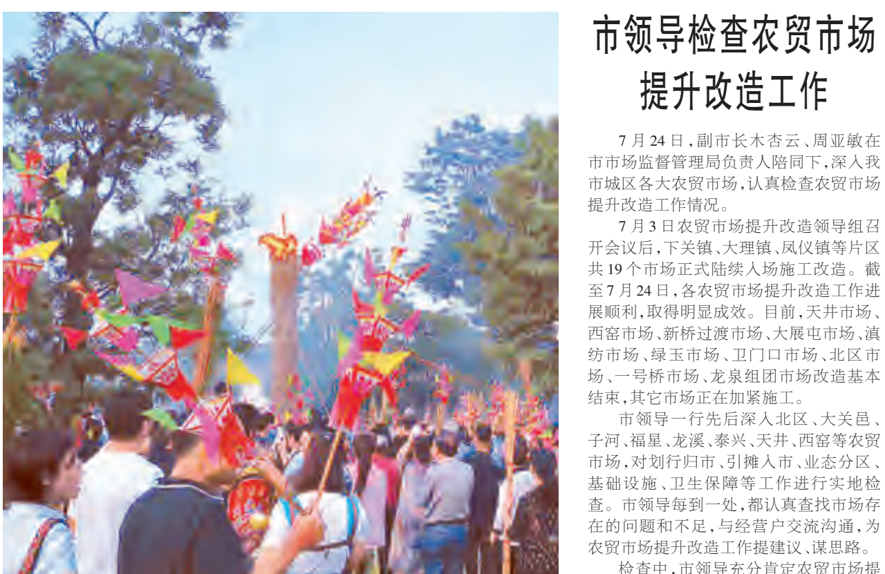
火把节是彝族、白族、纳西族等民族的传统节日,有着深厚的民俗文化内涵,被称为“东方的狂欢节”。7月27日,我市各族群众倾情欢度火把节,祈愿平安吉祥、五谷丰登。