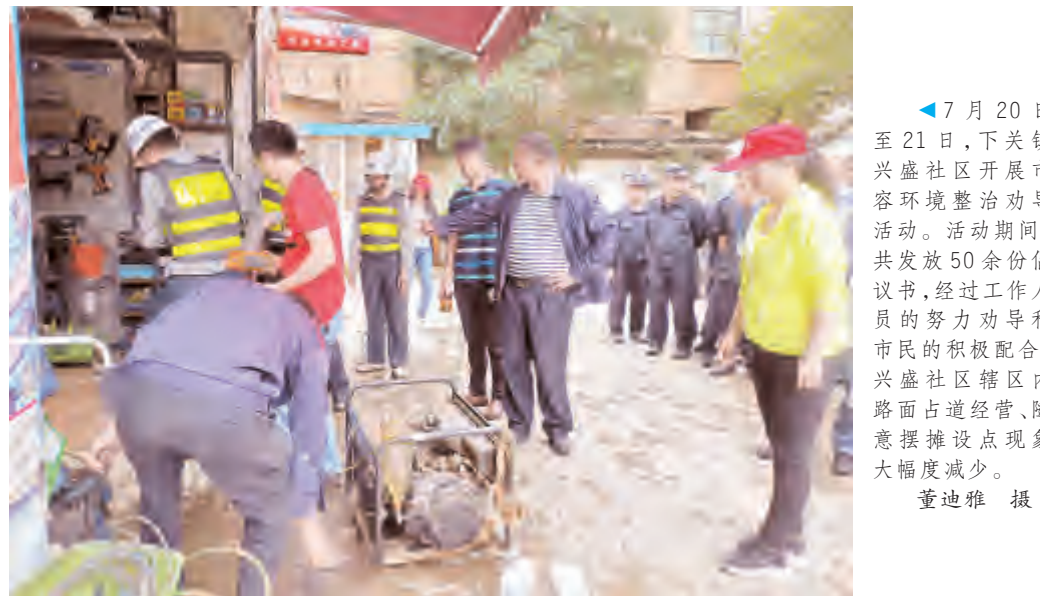
7月20日至21日,下关镇兴盛社区开展市容环境整治劝导活动。活动期间,共发放50余份倡议书,经过工作人员的努力劝导和市民的积极配合,兴盛社区辖区内路面占道经营、随意摆摊设点现象大幅度减少。