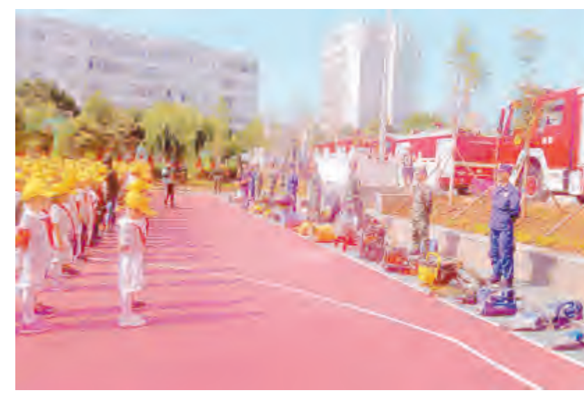
5月30日,市妇联联合下关九小,开展“大手拉小手,平安同行”庆“六一”活动。活动当天,邀请了市消防大队消防员、州交警支队女子大队警官,向孩子们宣讲了消防安全及交通安全知识;大理市花上花科普艺术团教唱了《消防曲》;对大理市2019年“优秀小公民”进行了表彰。

“洱海清,大理兴”。洱海,是大理人民的“母亲湖”,是大理人民赖以生存和发展的根基,是大理的核心竞争力和魅力所在。近年来,我市牢记习近平总书记“一定要把洱海保护好”的殷切嘱托,切实扛起洱海保护治理的政治担当,历史担当和责任担当,全市干群齐心协力,众志成城,举全市之力推进洱海保护治理攻坚战和持久战。洱海保护治理“七大行动”工作卓有成效,洱海生态环境保护“三线”划定等工作扎实推进……2018年,全湖水质实现了7个月Ⅱ类目标,洱海保护治理工作取得阶段性成效。新年伊始,洱海保护治理开启新篇章,迈向新征程。当前,我市全面部署各项工作,坚决打赢“八大攻坚战”,确保洱海保护治理及流域转型发展取得新成效。为进一步加强洱海保护宣传工作,动员每一个人从自己做起、从点滴做起,自