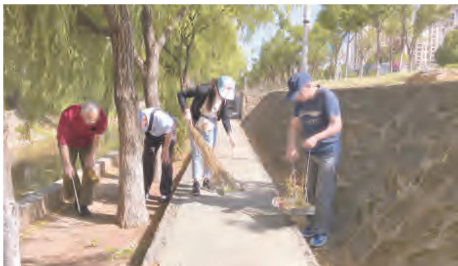
5月7日,日报社组织干部职工到凤仪镇凤鸣村开展“三清洁”环境卫生整治活动,对波罗江沿岸休闲道路、绿化带等区域的生活垃圾、枯枝杂草等进行清扫清除,为营造更加干净卫生、整洁有序、优美文明的人居环境积极贡献力量。