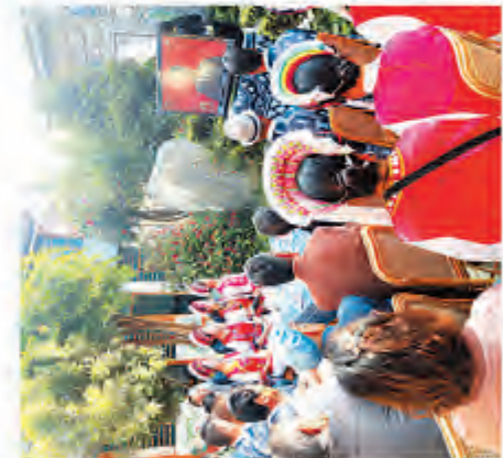
群众收看党的十九大开幕盛况