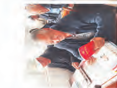
老党员学习新党章