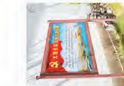
洱海海涂党建长廊