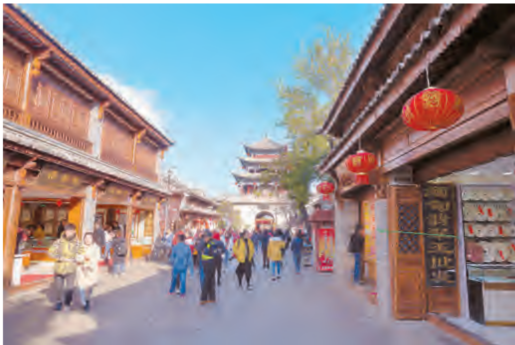
大理古城圆满完成提升改造整治试点段一、二期工作,完整地保留古城原有特色,恢复成为以清末民初为基调的白族民居建筑风格,同时规范经营秩序,实行强弱电线路入地,排除安全隐患。经过提升改造,古城面貌更加古色古香、韵味十足。