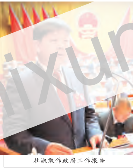
杜淑敢作政府工作报告