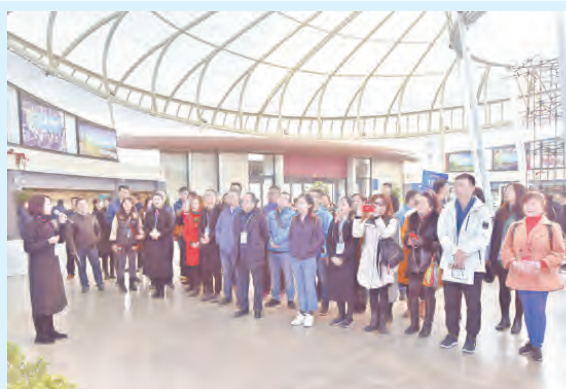
12月13日,“春城之变”强“四力”全媒体采访活动走进昆明,全国近百名传媒行业专家学者、媒体领军人物和全媒体记者来到中国(云南)自由贸易试验区昆明片区、昆明经开区融媒体中心等地,近距离见证昆明在经济发展、生态建设、媒体融合等方面的新变化。