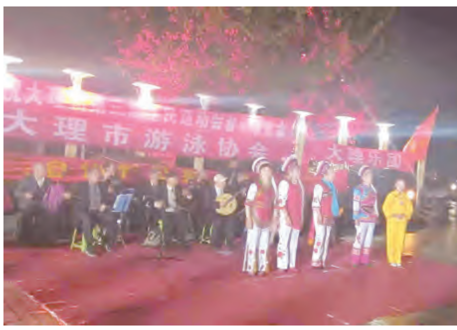
11月21日,市游泳协会联合有关协会、俱乐部、户外运动爱好者在西洱河畔举办庆祝全州第三届全民运动会暨庆祝建州63周年文艺联欢晚会,用歌声和舞蹈歌颂祖国和全州取得的伟大成就和人民群众追求积极健康向上的精神风貌,营造了浓厚的全民健身氛围。