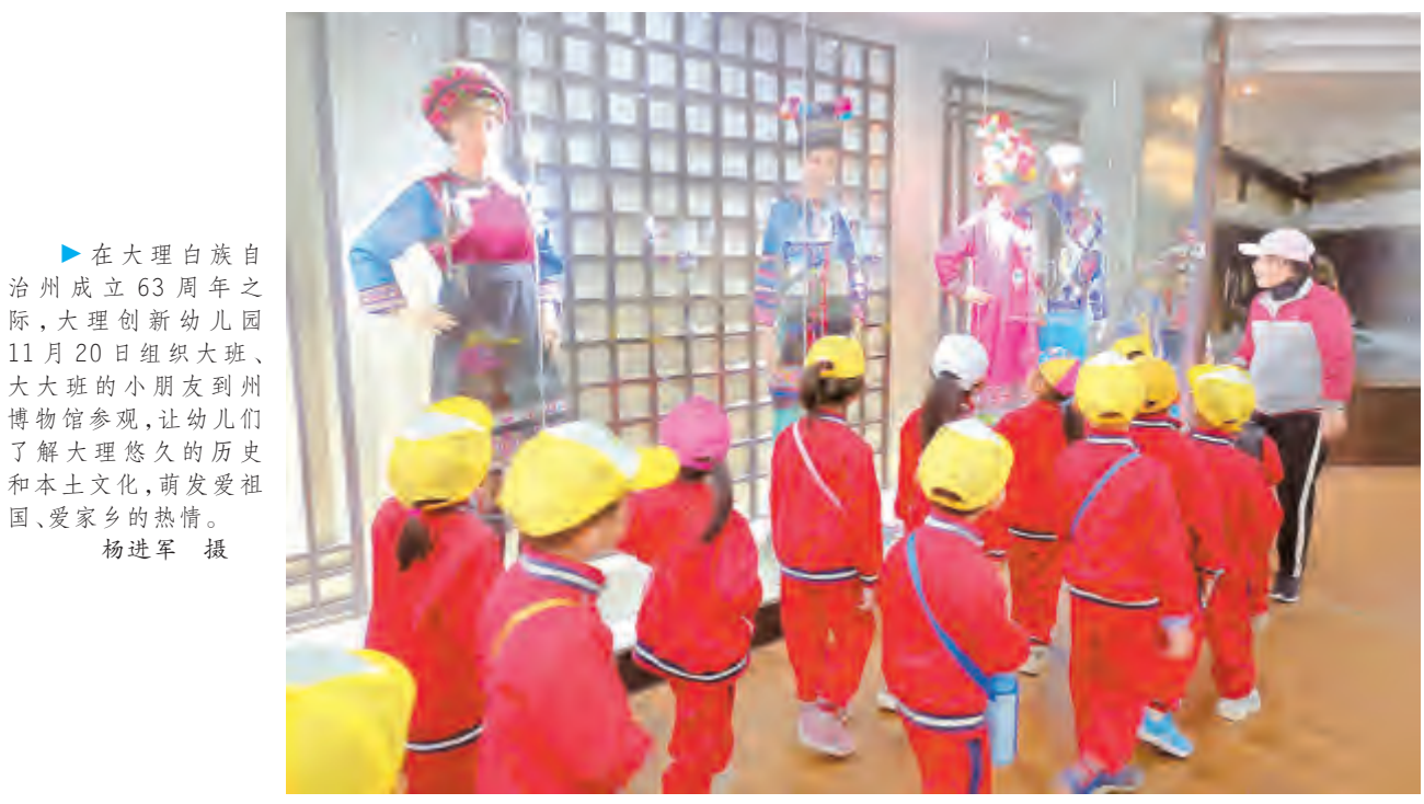
在大理白族自治州成立63周年之际,大理创新幼儿园11月20日组织大班、大大班的小朋友到州博物馆参观,让幼儿们了解大理悠久的历史和本土文化,萌发爱祖国、爱家乡的热情。

队活动,同学们非常喜欢讲红色故事,有时候讲得入情入境了,就有同学攥着拳头拍桌子、跺脚,比如讲王二小的故事就有很多同学淌眼泪,我听了那些革命故事后,觉得革命先辈们为了祖国和人民都那么努力,我们现在就应该在学生时代好好学习,长大以后报效祖国。” 在开展红色文化教育活动中,下关八小加强党支部建设、教师队伍建设,连续十年荣获“名校”表彰,受到市委、市政府表彰的党员名师达17人次,形成了“党建强、教学强”的“双强”格局,先后被授予“大理州基层党建先锋模范作用发挥示范点”“大理州党建工作示范学校”等荣誉称号。 记者 徐建伟 杨阳