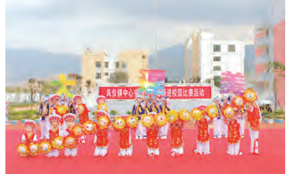
我市各中小学围绕立德树人根本任务,积极开展中华优秀传统文化教育,弘扬和传承优秀传统文化,丰富青少年校园文化生活,激发青少年爱祖国、爱家乡的热情。图为11月13日凤仪镇中心完小举行白族舞蹈进校园比赛活动。