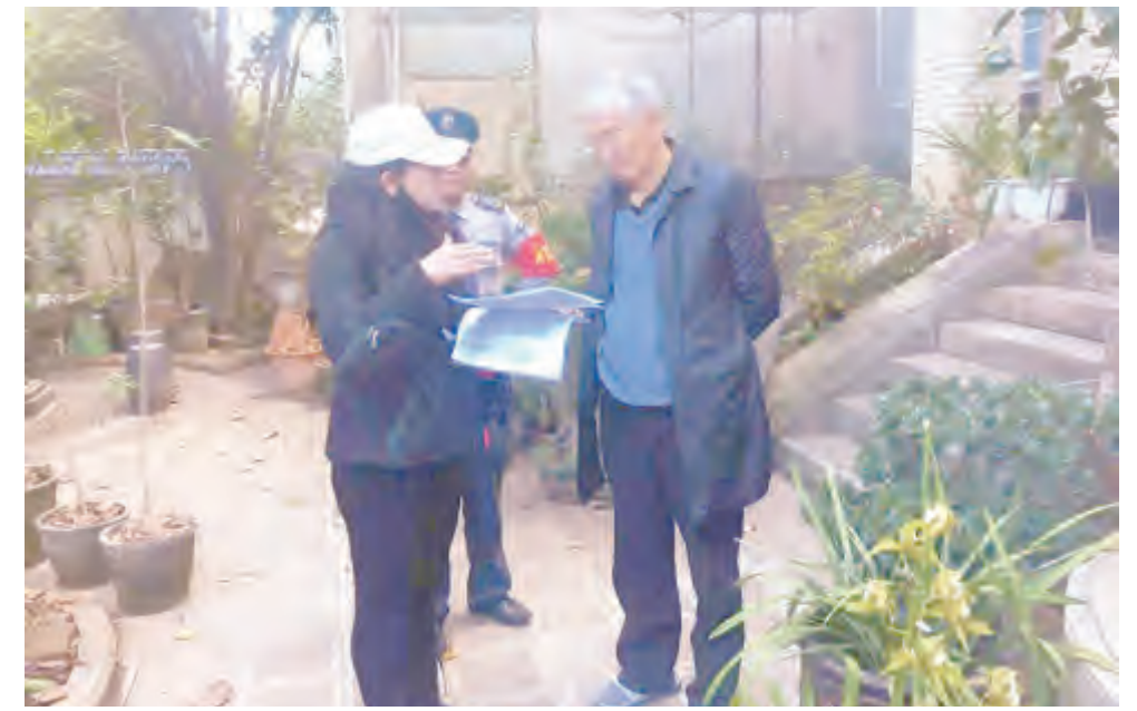
近日,下关镇关迳社区科协开展以“保护‘母亲湖’洱海”为主题的科普宣传活动。活动中,社区工作人员入户向居民发放保护“母亲湖”洱海的倡议书,倡导广大居民远离生活陋习,不沿河倾倒垃圾,定点投放生活垃圾,爱护环境,以实际行动保护洱海。宣传活动收到良好效果,进一步增强了广大居民自觉保护洱海的意识。