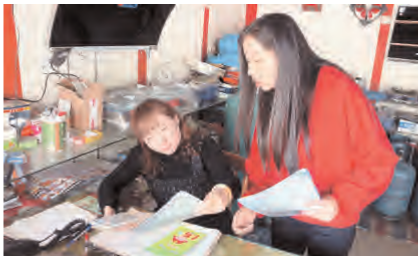
为大力弘扬勤俭节约、艰苦奋斗精神，积极配合创建文明城市工作，进一步增强广大社区居民文明意识，11月11日，下关镇吉苍社区工作人员、志愿者到辖区内的饭店、小餐馆开展文明餐桌宣传行动。